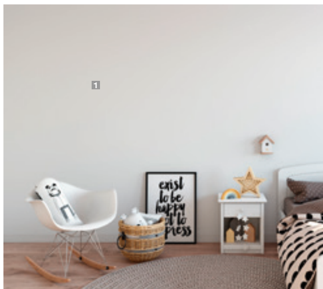
1 kiwi:blueberry:pumpkin:weiß 3:1:2:30