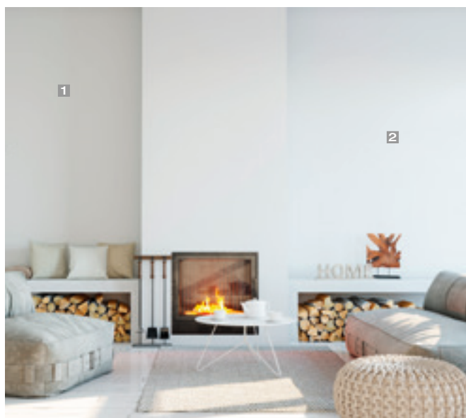
1 cherry:blueberry:weiß 1:1:10 2 cherry:blueberry 1:1

Alle sieben Farbtöne von Vitamix 9018 sind natürlich auch untereinander mischbar. Somit erweitert sich der Farbraum um ein Vielfaches – lassen Sie Ihrer Kreativität freien Lauf. Und wenn es ein ganz bestimmter Farbton sein soll, auch kein Problem: Über eine Werksanfertigung bekommen Sie Ihren Wunschfarbton auch farbtongenau erstellt – natürlich auch konservierungsmittelfrei.