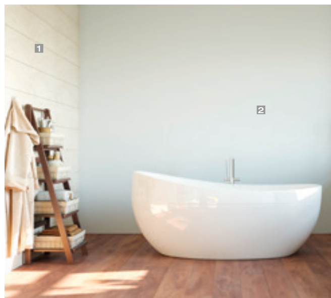
1 pumpkin:orange:weiß 3:1:20 2 blueberry:kiwi:weiß 1:3:20